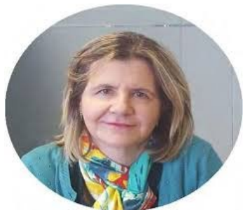
Luisa Berrio Ministerio de Política Territorial y Función Pública - España