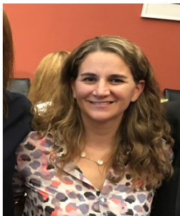
Analía Casali Subsecretaría de Fortalecimiento Institucional – Argentina